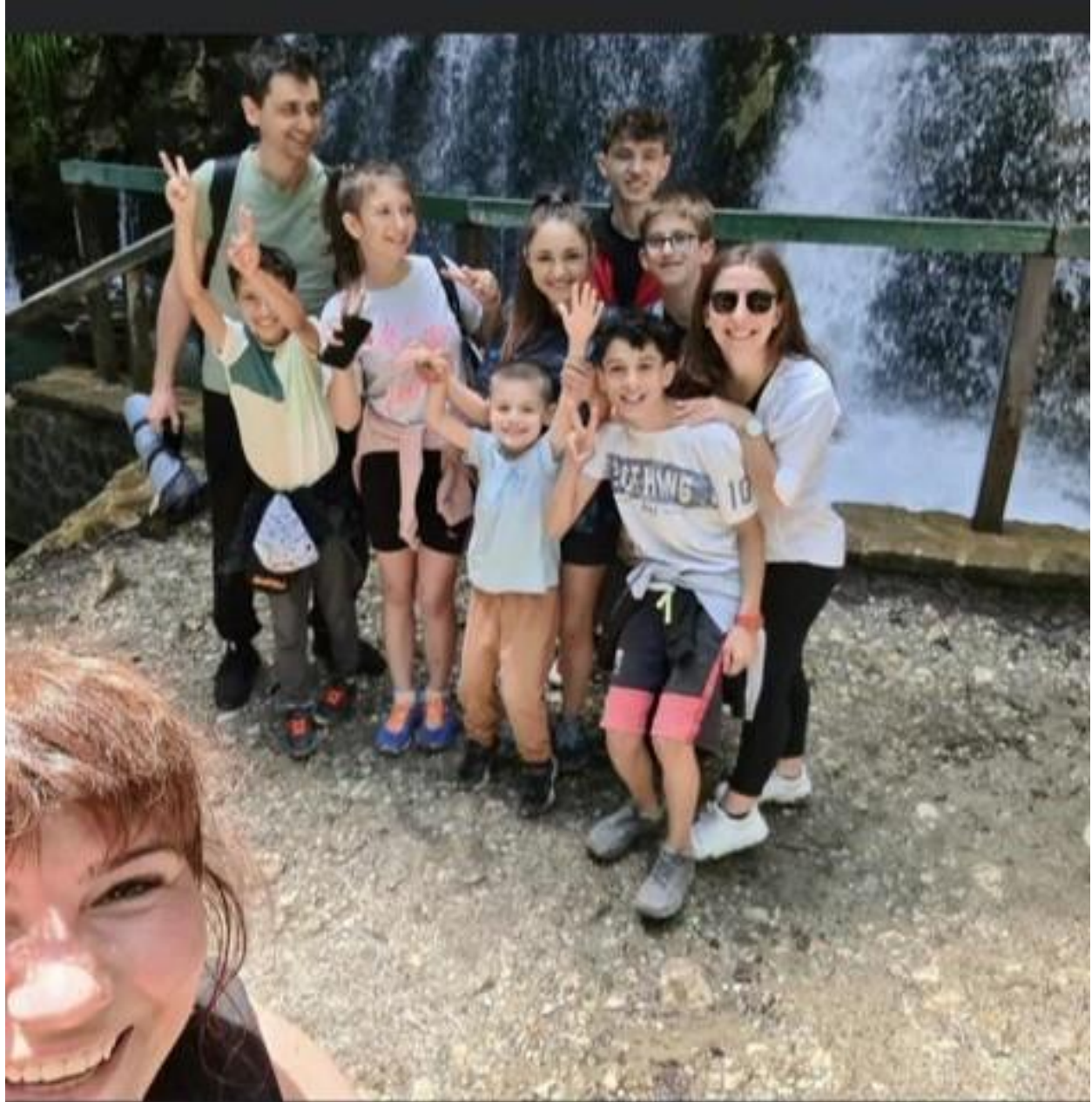
Excursie la Busteni