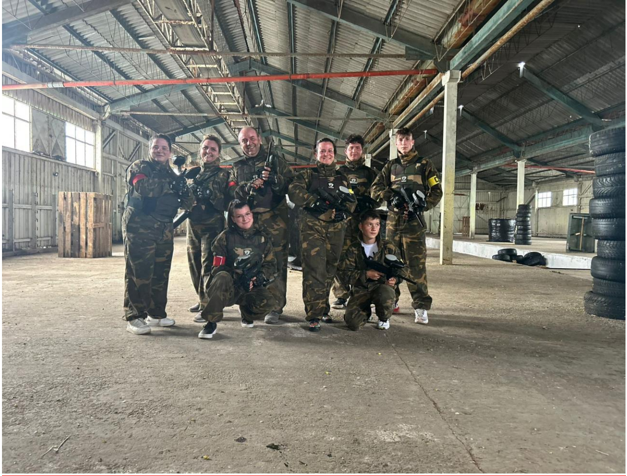
O zi la Paintball