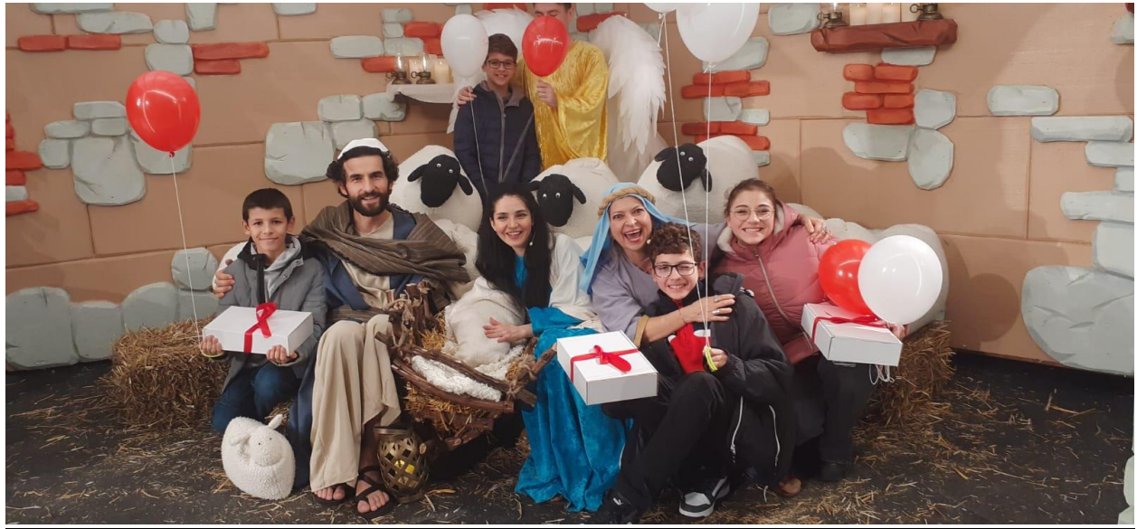
Spectacol de Craciun